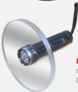
Plexiglasscheibe mit eingebauter LED-Leuchte (optional)

Die zu prüfenden Saugschläuche können in optimaler Höhe auf dem Prüfwagen gelagert werden. Nach Anschluss der A-Kupplung kann der Saugschlauch mit der dazu gehörenden, im Prüfwagen eingebauten Vakuumpumpe mit einem 90%igen Unterdruck beaufschlagt werden. Der Blick ins Innere des Schlauches erfolgt durch eine Plexiglasscheibe mit optional eingebauter oder separater LED-Leuchte.